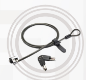
Doppio lucchetto Kensington® Lenovo™