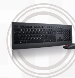
Combinazione di mouse e tastiera wireless Lenovo Professional